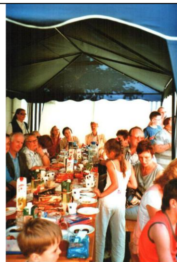
Общение и чаепитие по окончании «торжественной части»