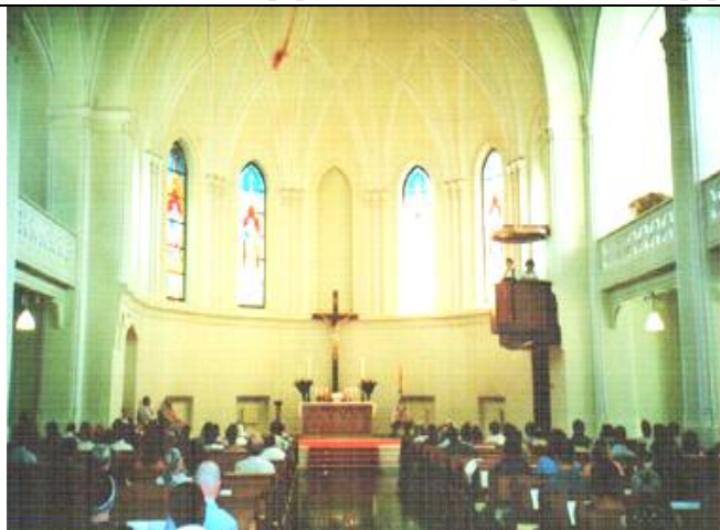
Во время богослужения