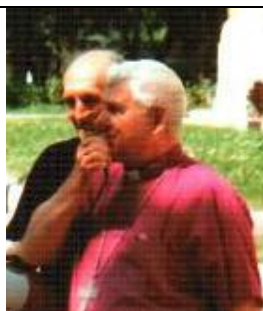
Архиепископ ЕЛЦ Август Крузе