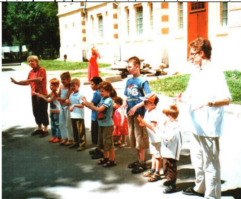
а также детская группа общины